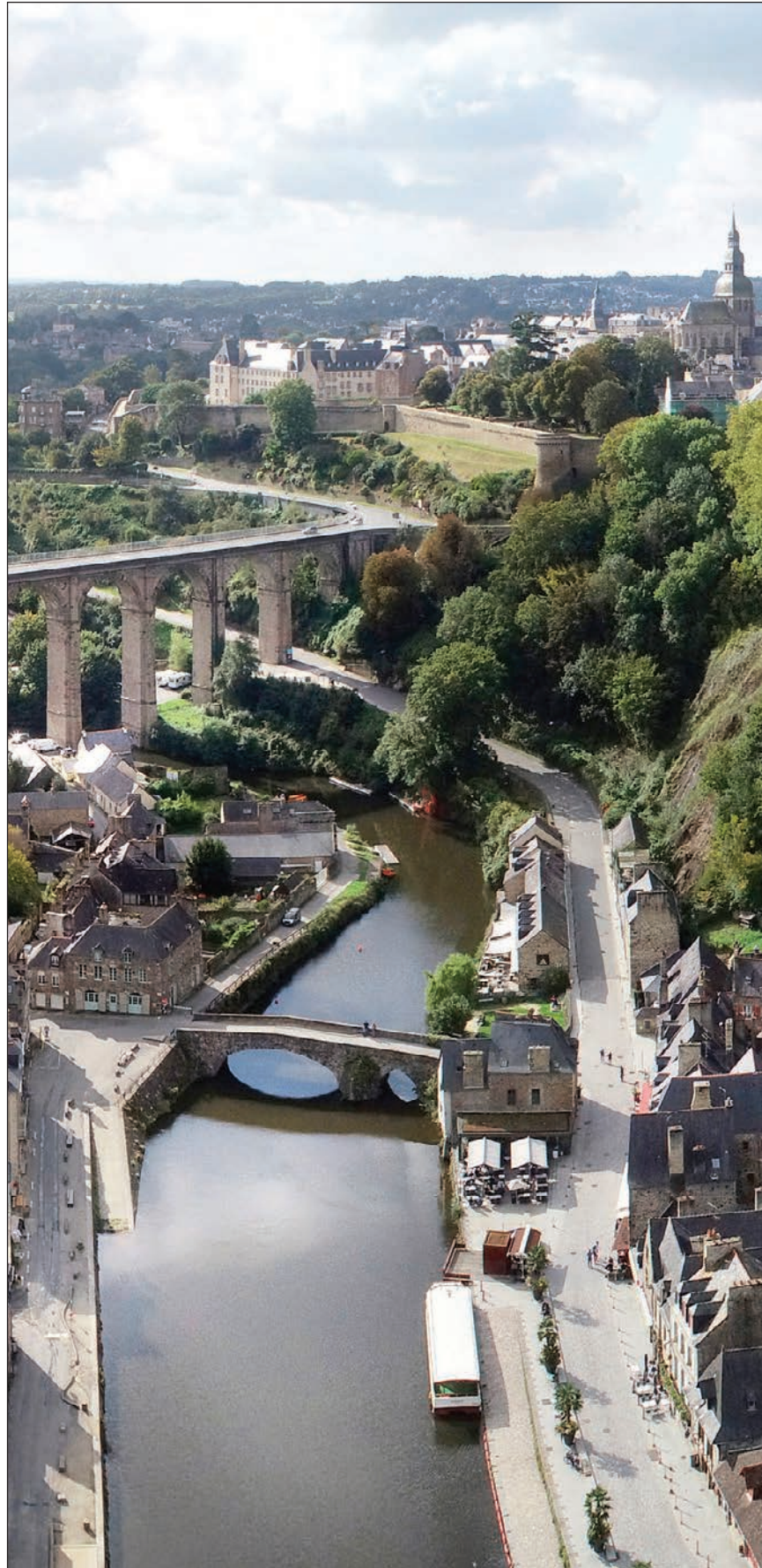
Fig. 1 : Canal d'Ille et Rance - port fluvial de Dinan

Ces points d'articulation engendrent naturellement le questionnement du PSMV, document d'urbanisme de son temps, qui nécessite une mise à jour logique.